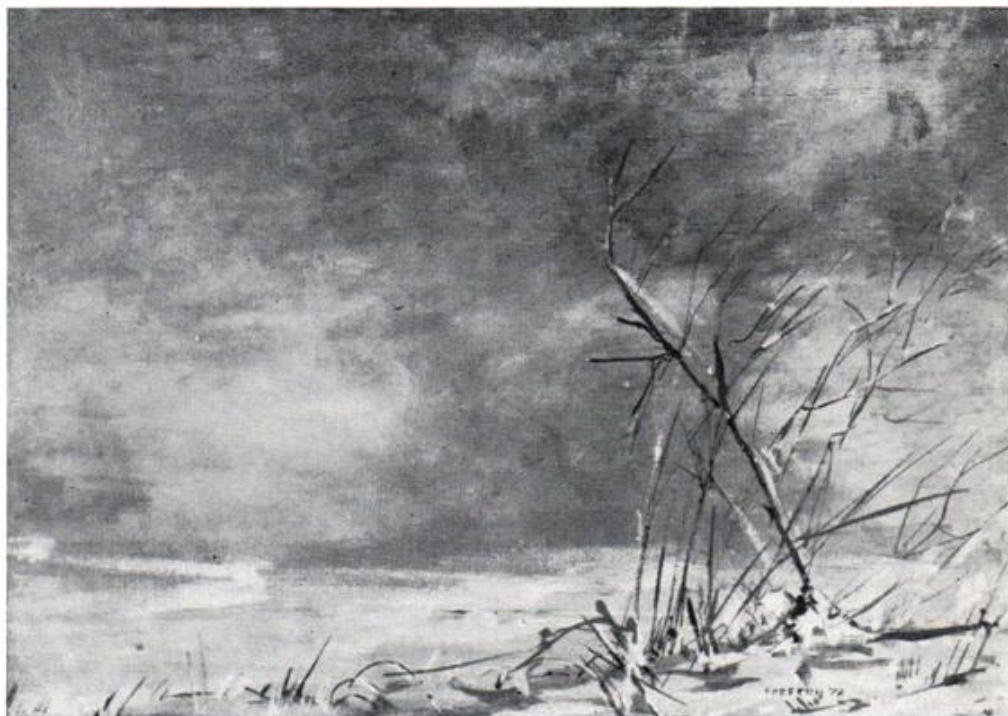
Arbusti fra la neve, olio, cm. 30x40.