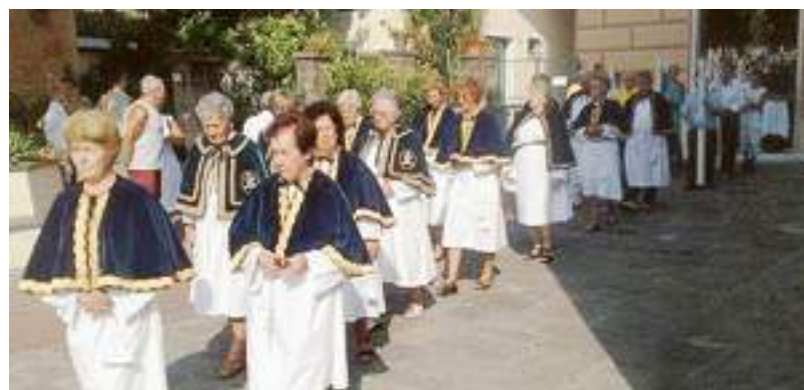
Le consorelle del Suffragio in attesa dell'arca della Madonna

Arriva l'arca della Madonna del santuario di Nostra Signora del Suffragio e il clima della grande festa, che culminerà con la processione e le sparate pirotecniche dell'8 settembre, è ufficialmente inaugurato. La celebrazione dell'accoglienza dell'icona nel santuario, accompagnata dai confratelli e dalle consorelle del Suffragio, oltre che dai rappresentanti dei Quartieri, è stata un momento di tradizionale devozione, sottolineata dall'intervento di don Pietro Lupo, rettore del santuario. Alla presenza delle autorità cittadine, l'arca è stata salutata da una salva di 21 colpi e dall'alzabandiera dei bambini.