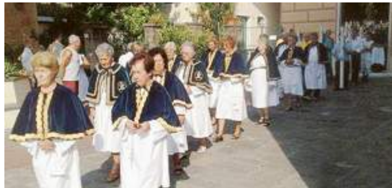
Le consorelle del Suffragio in attesa dell'arca della Madonna

Arriva l'arca della Madonna del santuario di Nostra Signora del Suffragio e il clima della grande festa, che culminerà con la processione e le sparate pirotecniche dell'8 settembre, è ufficialmente inaugurato. La celebrazione dell'accoglienza dell'icona nel santuario, accompagnata dai confratelli e dalle consorelle del Suffragio, oltre che dai rappresentanti dei Quartieri, è stata un momento di tradizionale devozione, sottolineata dall'intervento di don Pietro Lupo, rettore del santuario. Alla presenza delle autorità cittadine, l'arca è stata salutata da una salva di 21 colpi e dall'alzabandiera dei bambini.