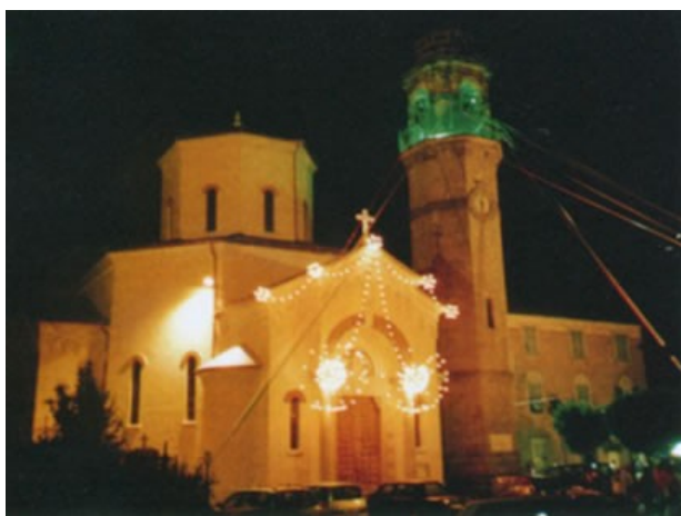
Magnasco - La chiesa di San Bartolomeo